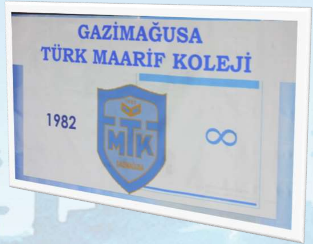
Türk Maarif Koleji Karşılama