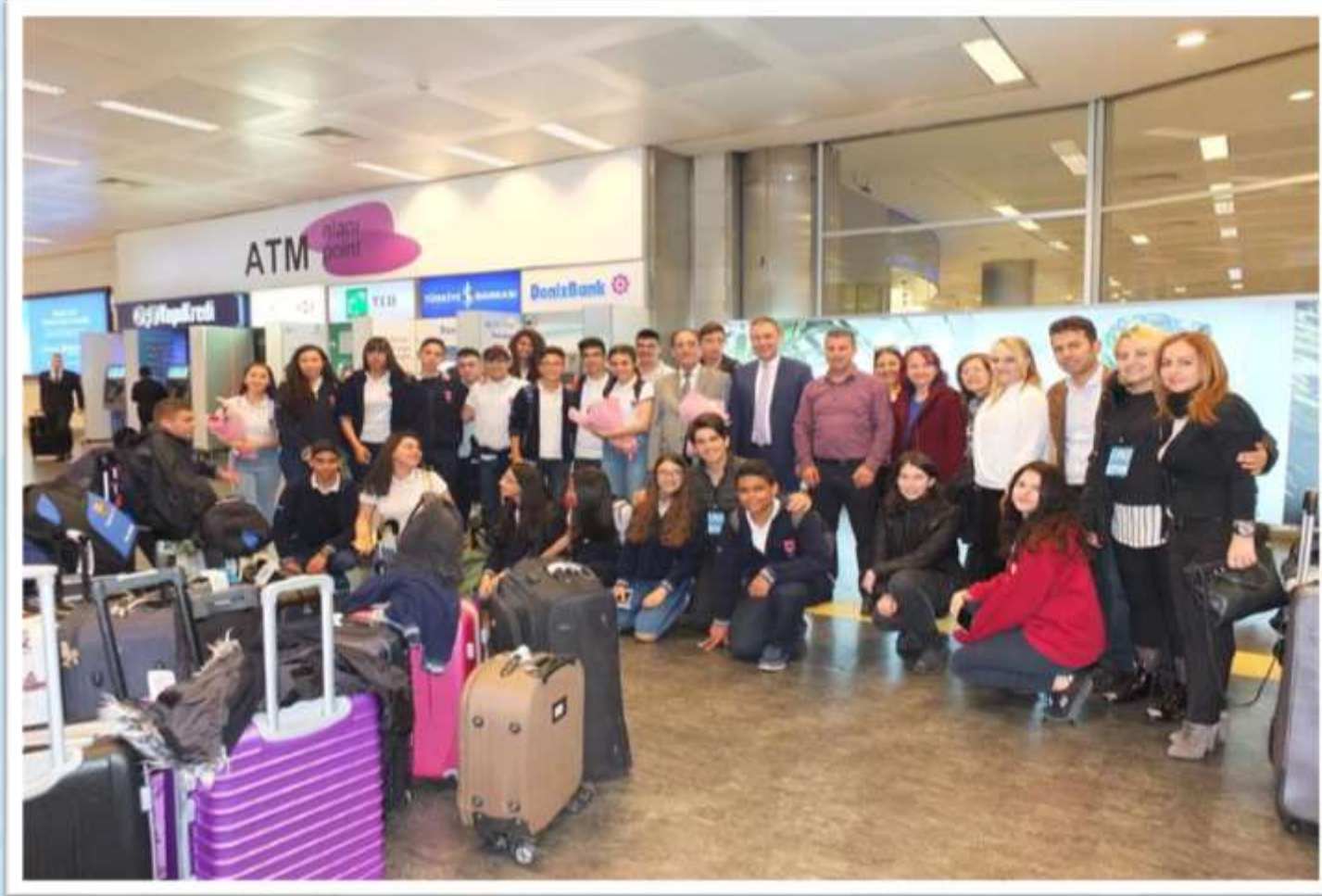
Misafirlerimizi Atatürk Hava Limanında karşıladık