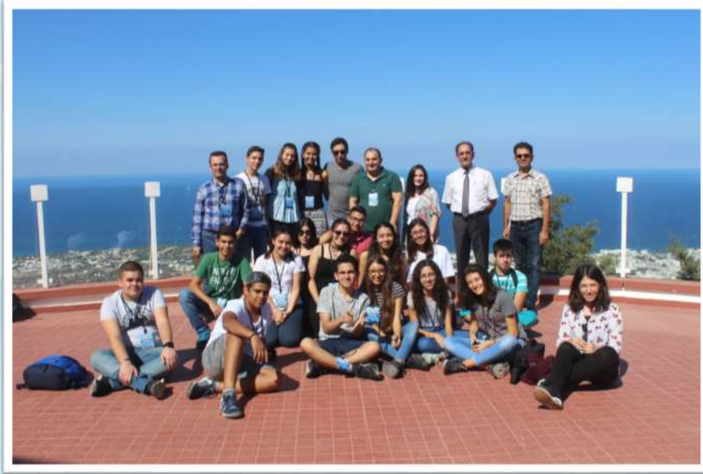
Girne Beyaz Ev Öğle Yemeği