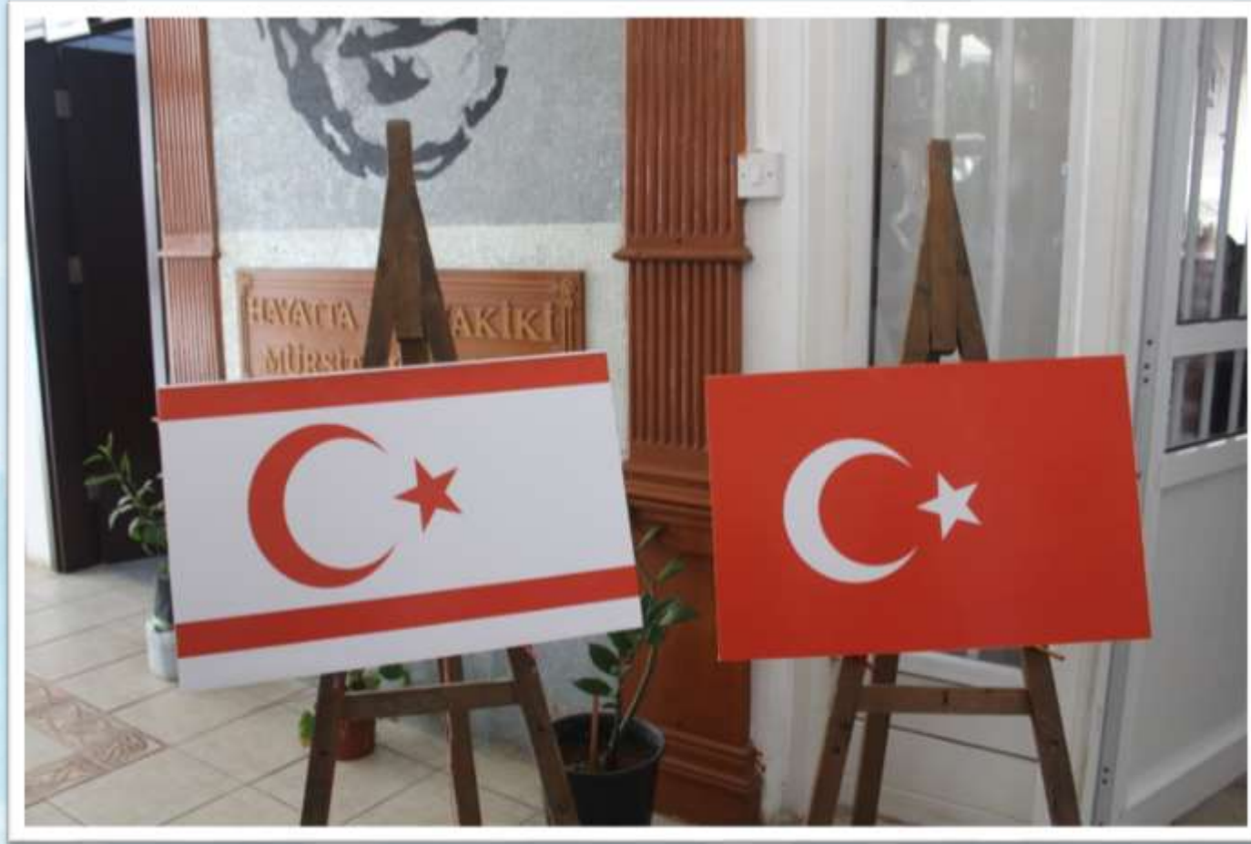
Türk Maarif Koleji Karşılama