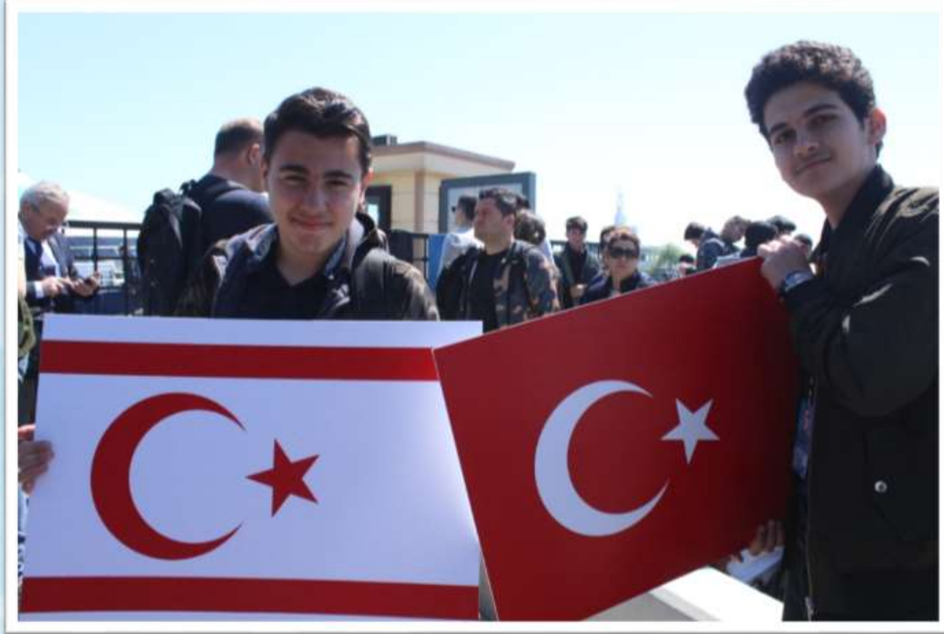
İstanbul Boğaz turu