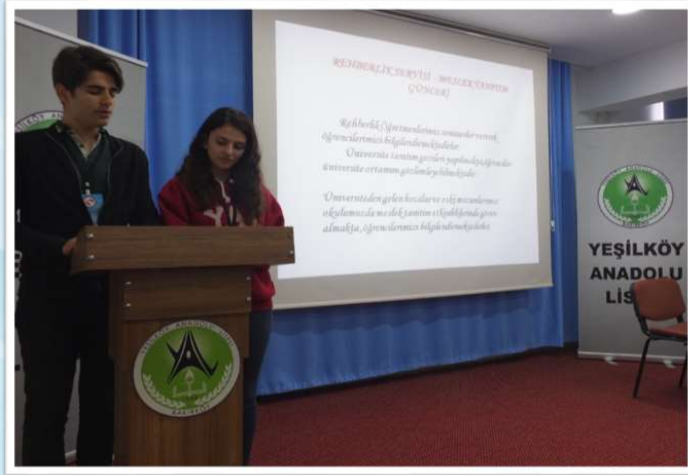
Kahvaltının ardından Konferans salonunda okulumuzun tanıtımı yapıldı