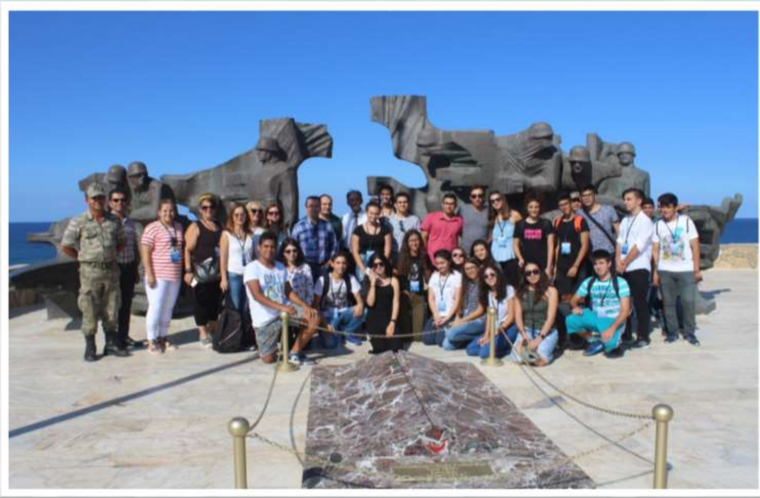
Girne – Karaoğlanoğlu şehitliği