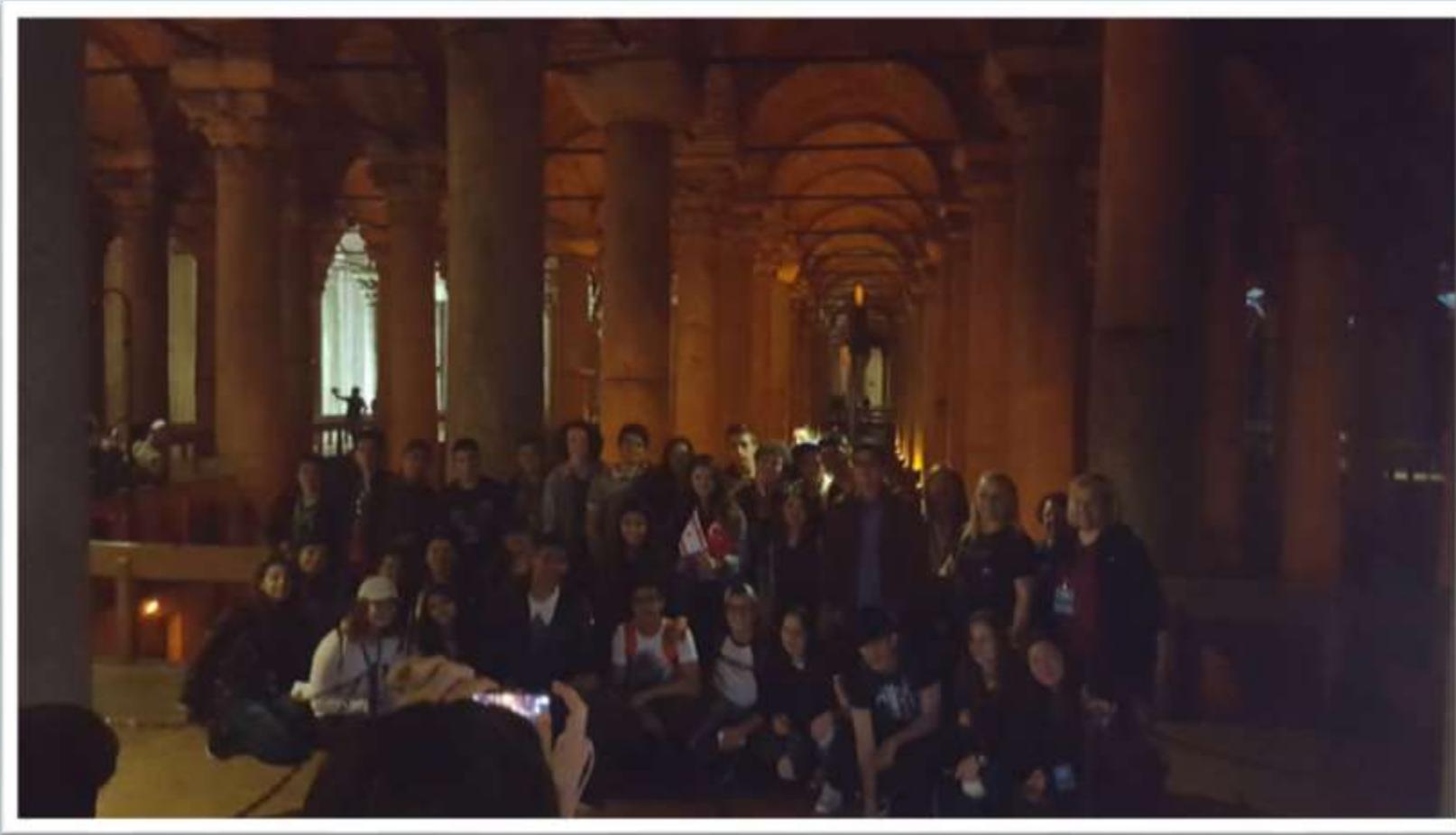
Yerebatan Sarnıcı Gezisi