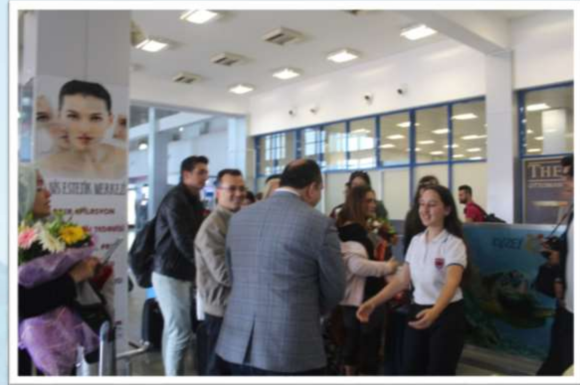
Ercan Hava Limanının da karşılama töreni ve ardından gerçekleşen tanıtım etkinlikleri