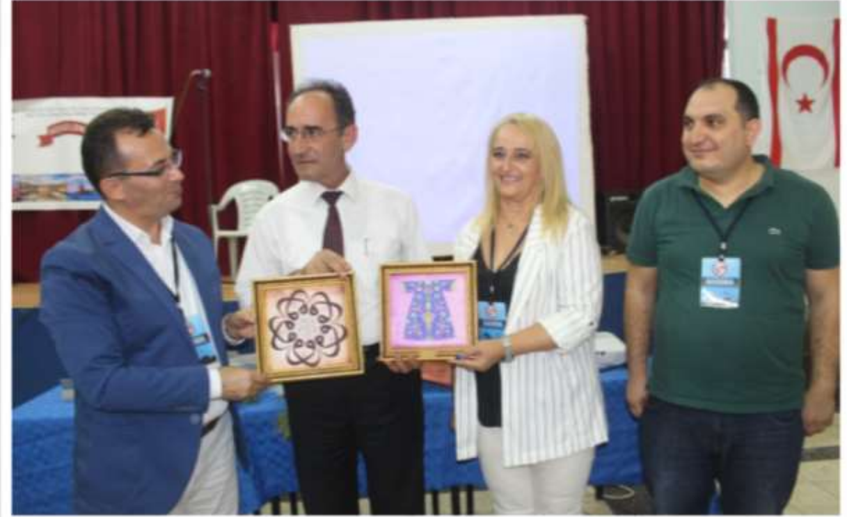
Tanıtım sonrası Bursa İpeği üzerine yapılmış, Hat sanatı örneklerinin okula hediye edilmesi