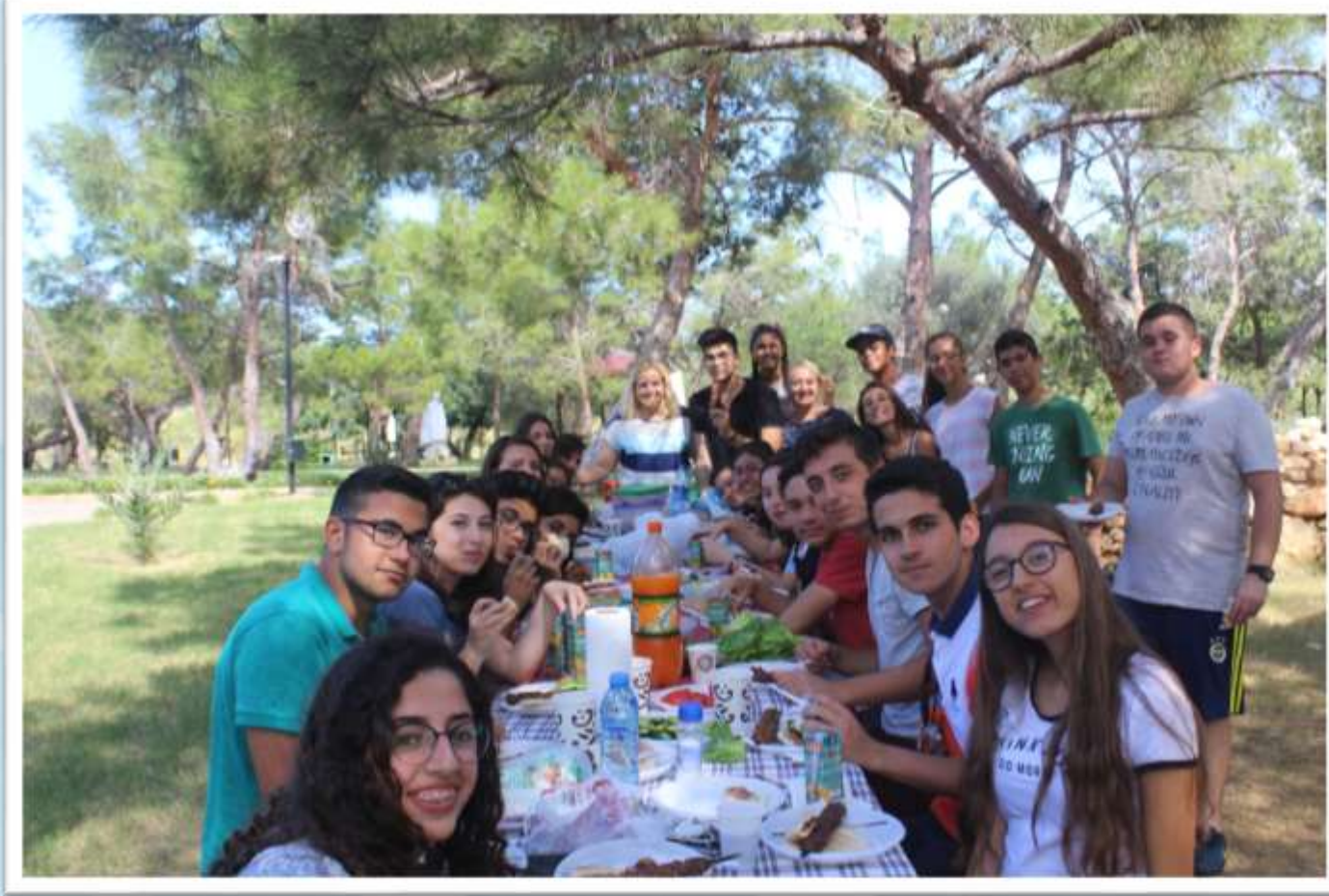
Dip Karpaz Büyükkonuk gezisi ve kapanış töreni