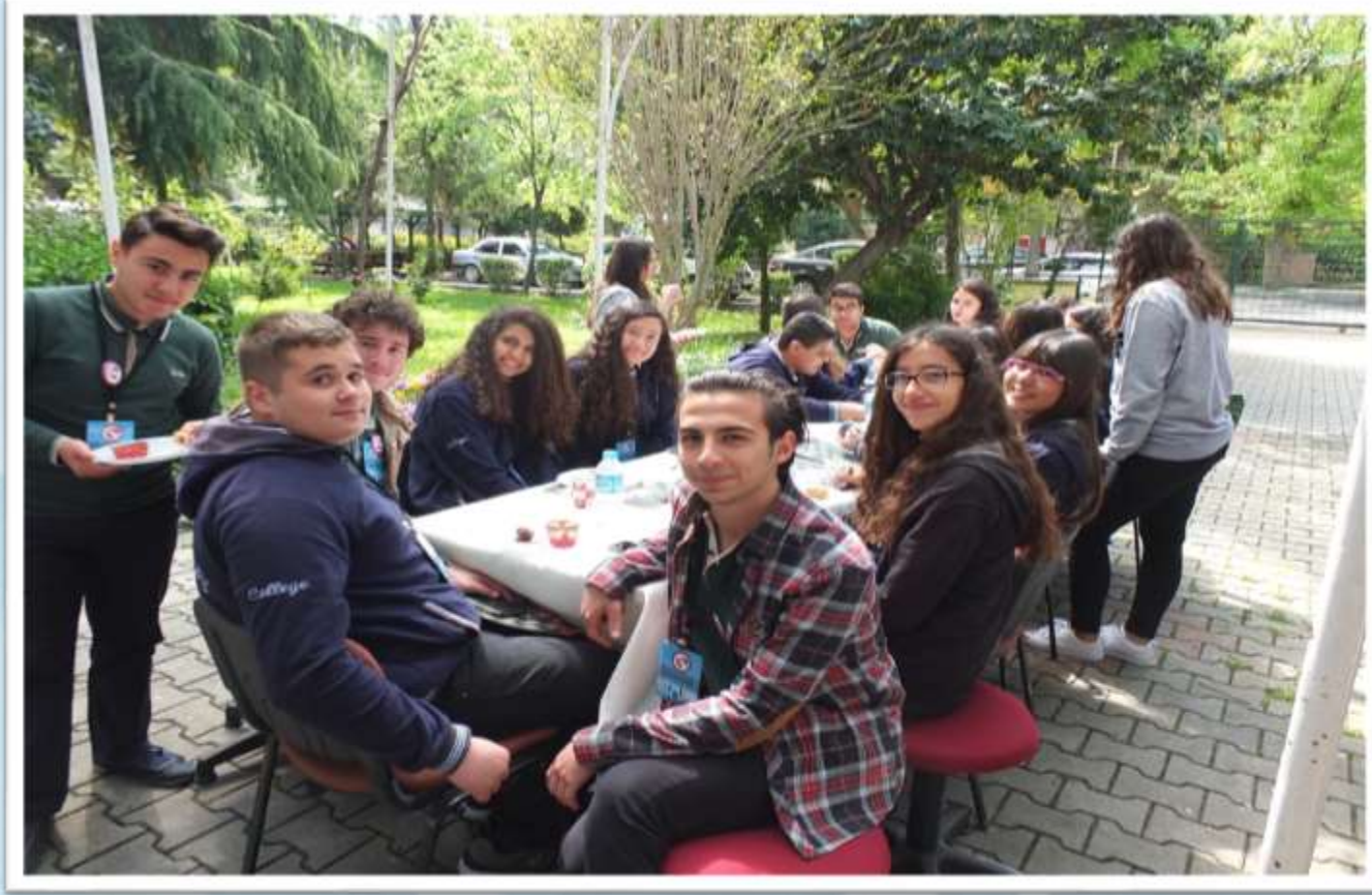
Hoş geldiniz kahvaltısı