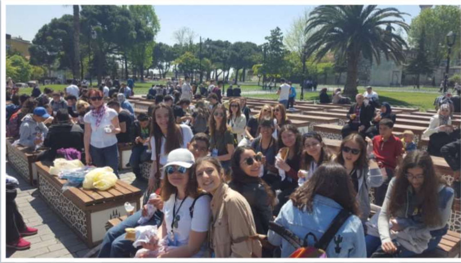
Sultanahmet Camii Ve Meydanı