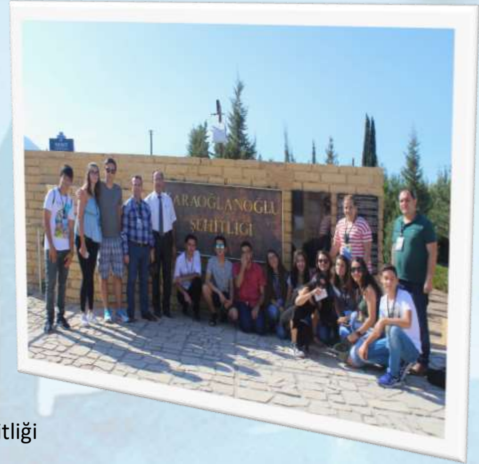
Girne – Karaoğlanoğlu şehitliği