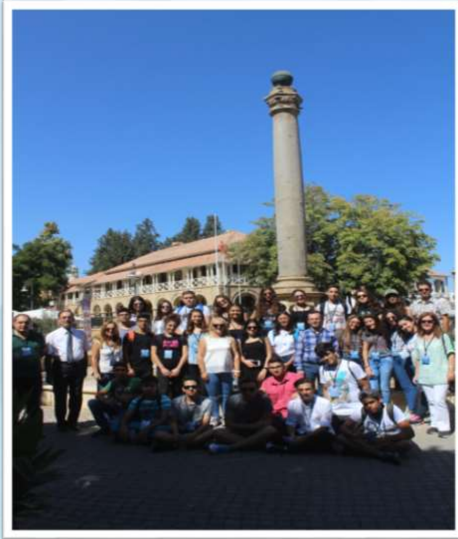
Lefkoşa Venedik Sütunu