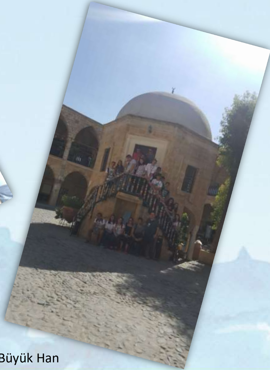
Lefkoşa -Büyük Han