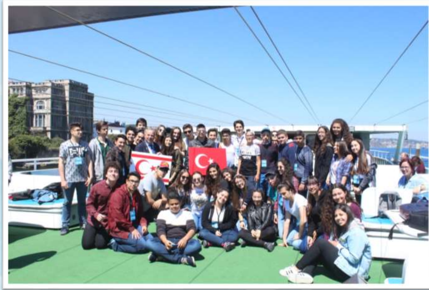
Kıbrıs gazisi ile teknede sohbet