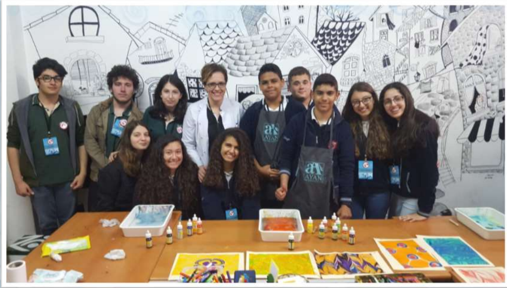
Görsel Sanatlar öğretmenimiz ile ebru etkinliği gerçekleştirdik