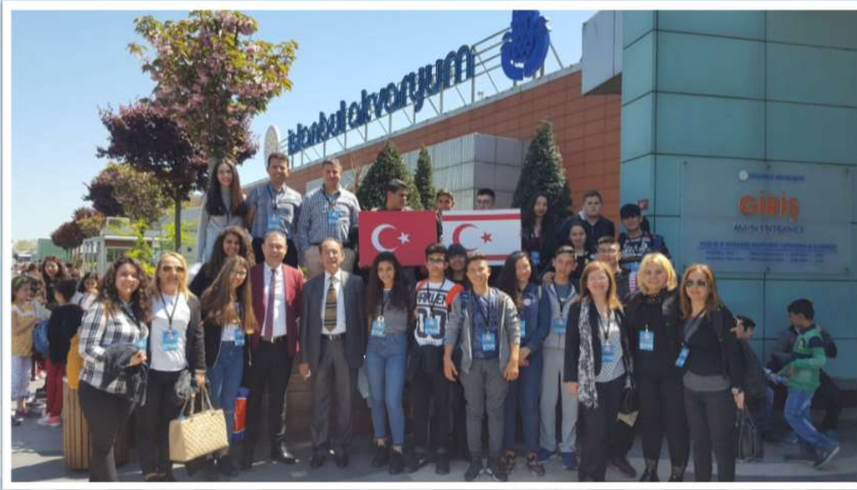
İstanbul Akvaryum gezisi