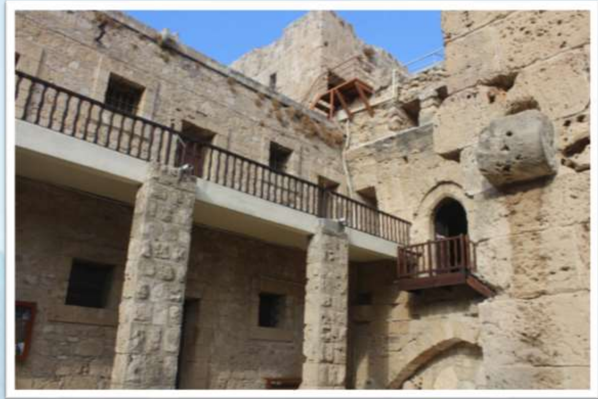
Girne Kalesi - Dünyanın en eski batık gemisi