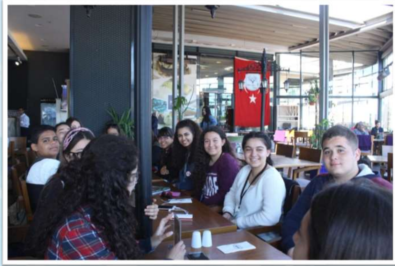
Akvaryum cafe serbest zaman