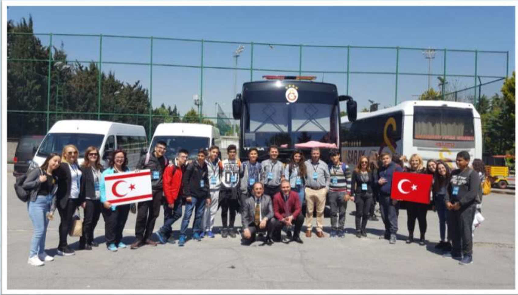
Galatasaray Spor Kulübü tesisleri gezisi