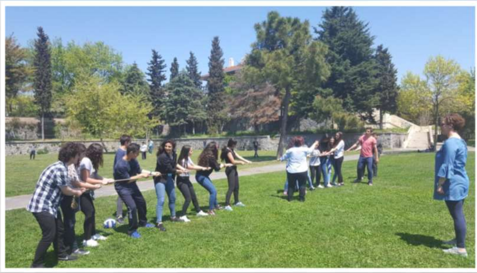
Piknik İp çekme yarışı