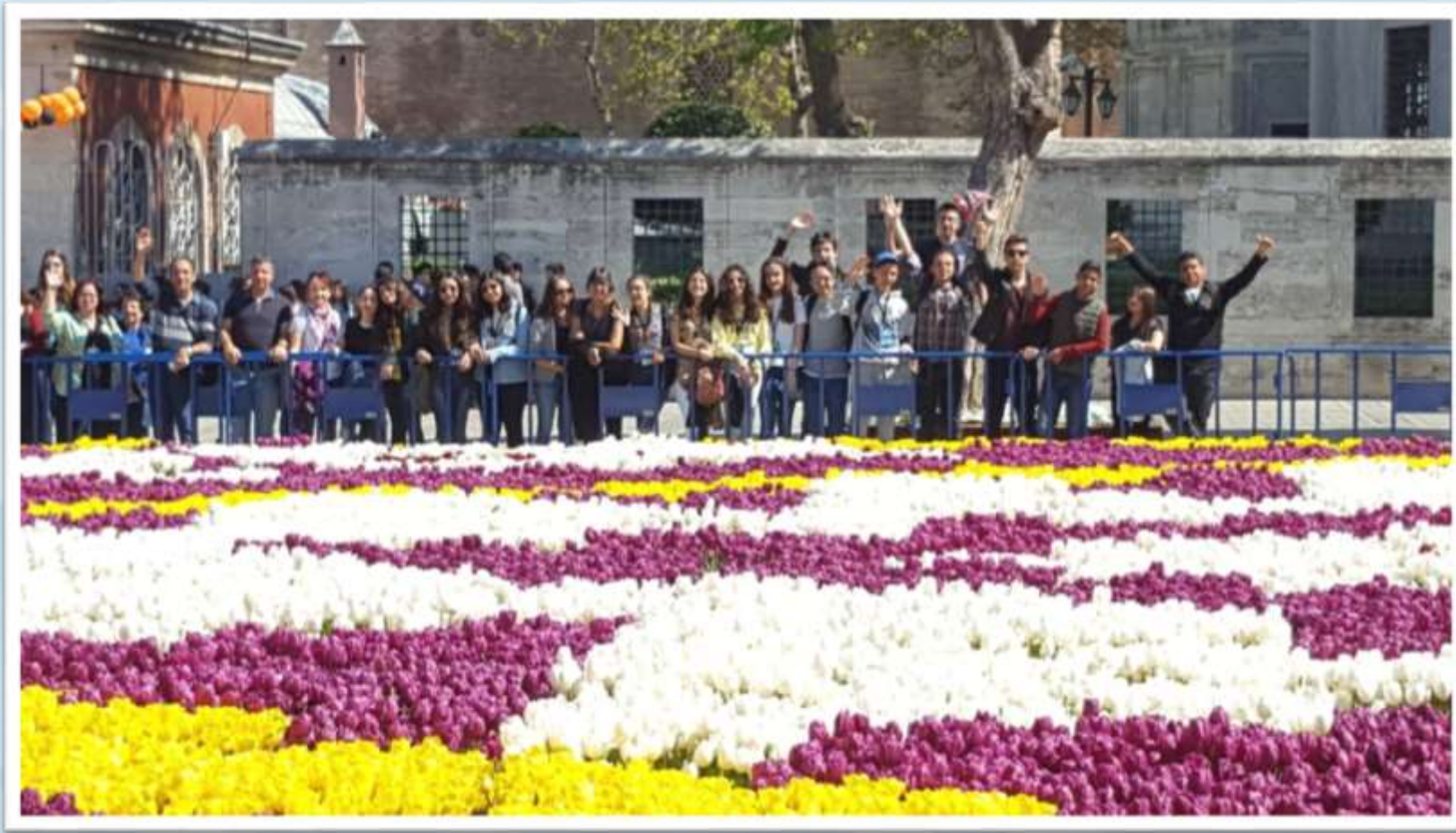
Sultanahmet Meydanı gezisinde Lale festivali kapsamında yapılmış Laleden halı