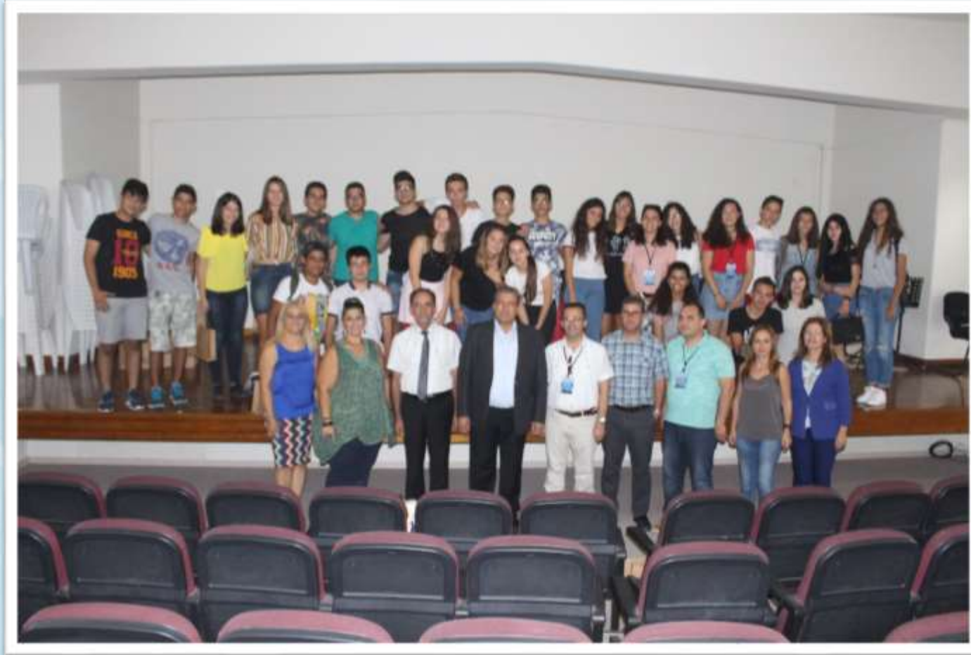
Gazimağusa belediye başkanını ziyaret