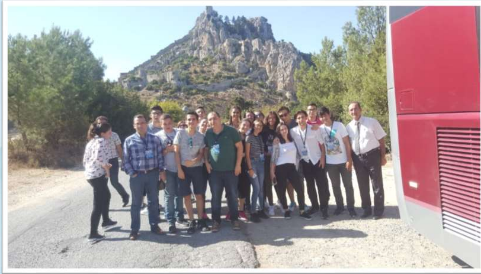
Saint Hilarion Kalesi- Girne