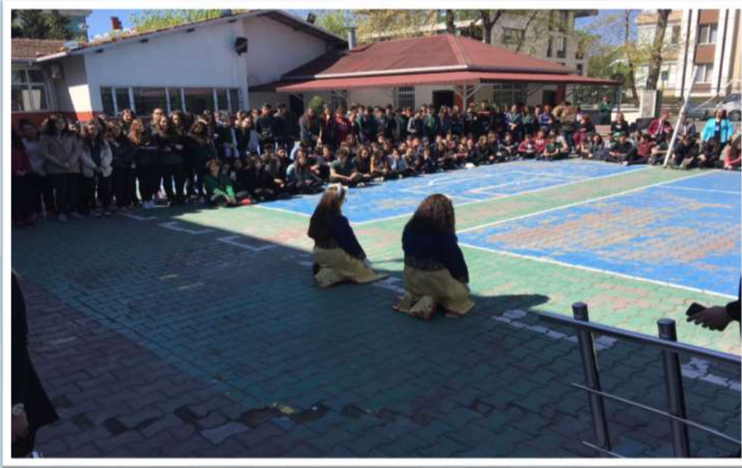
Türk Maarif Koleji okulumuz bahçesinde folklor gösterisi