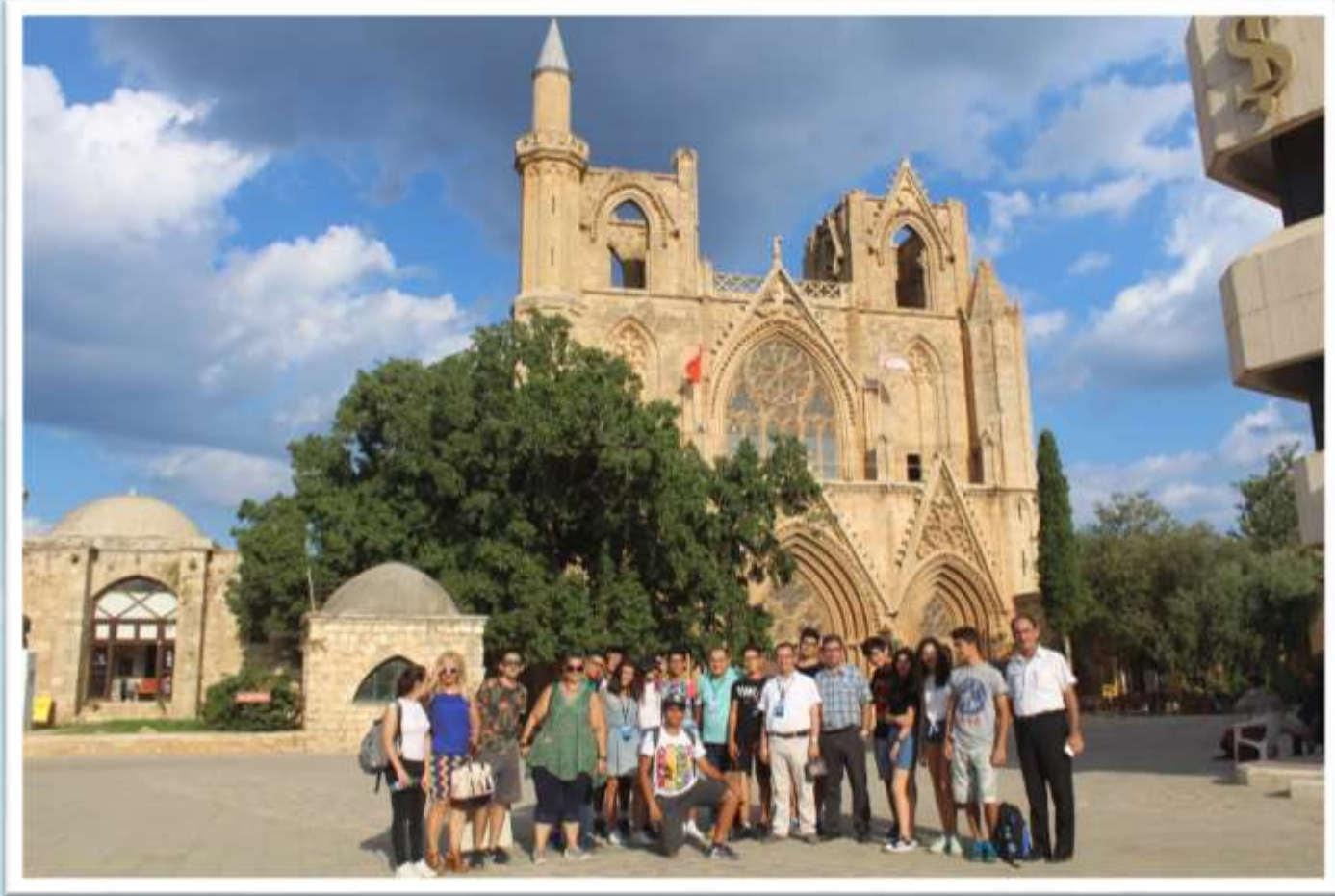
Gazi Mağusa Lala Mustafa Paşa Camii