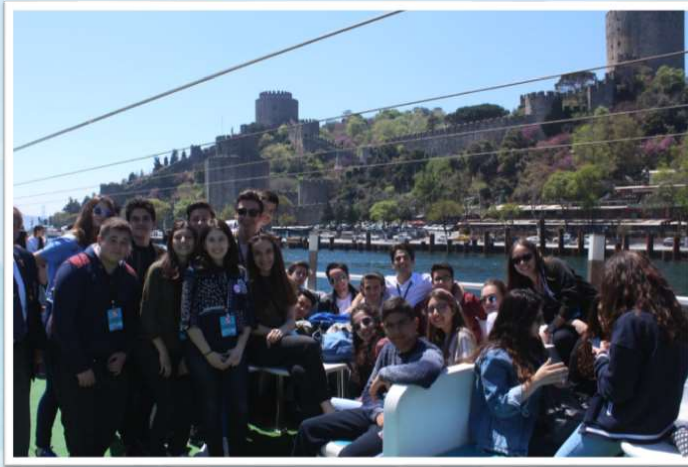
Boğaz Turu Rumeli Hisarı