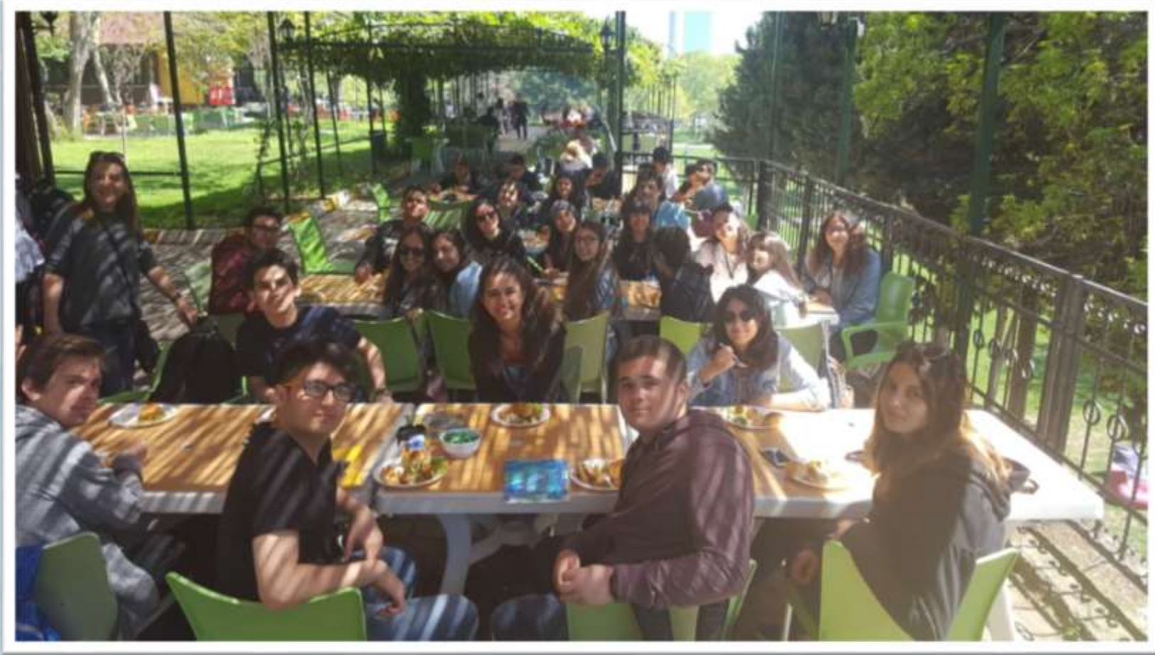
Rönepark'ta Yeşilköy Anadolu ve Türk Maarif Koleji aile pikniği