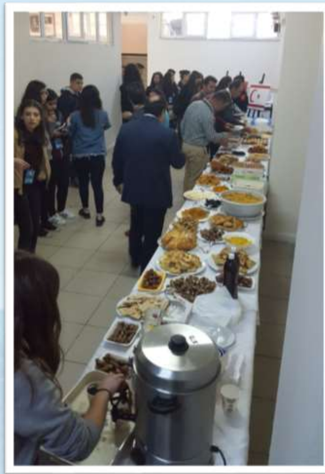
Kıbrıs ve Türkiye yöresel yemeklerinden oluşan yemek ziyafeti