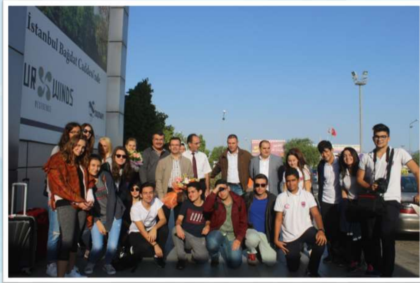
KKTC Ercan Hava Limanı