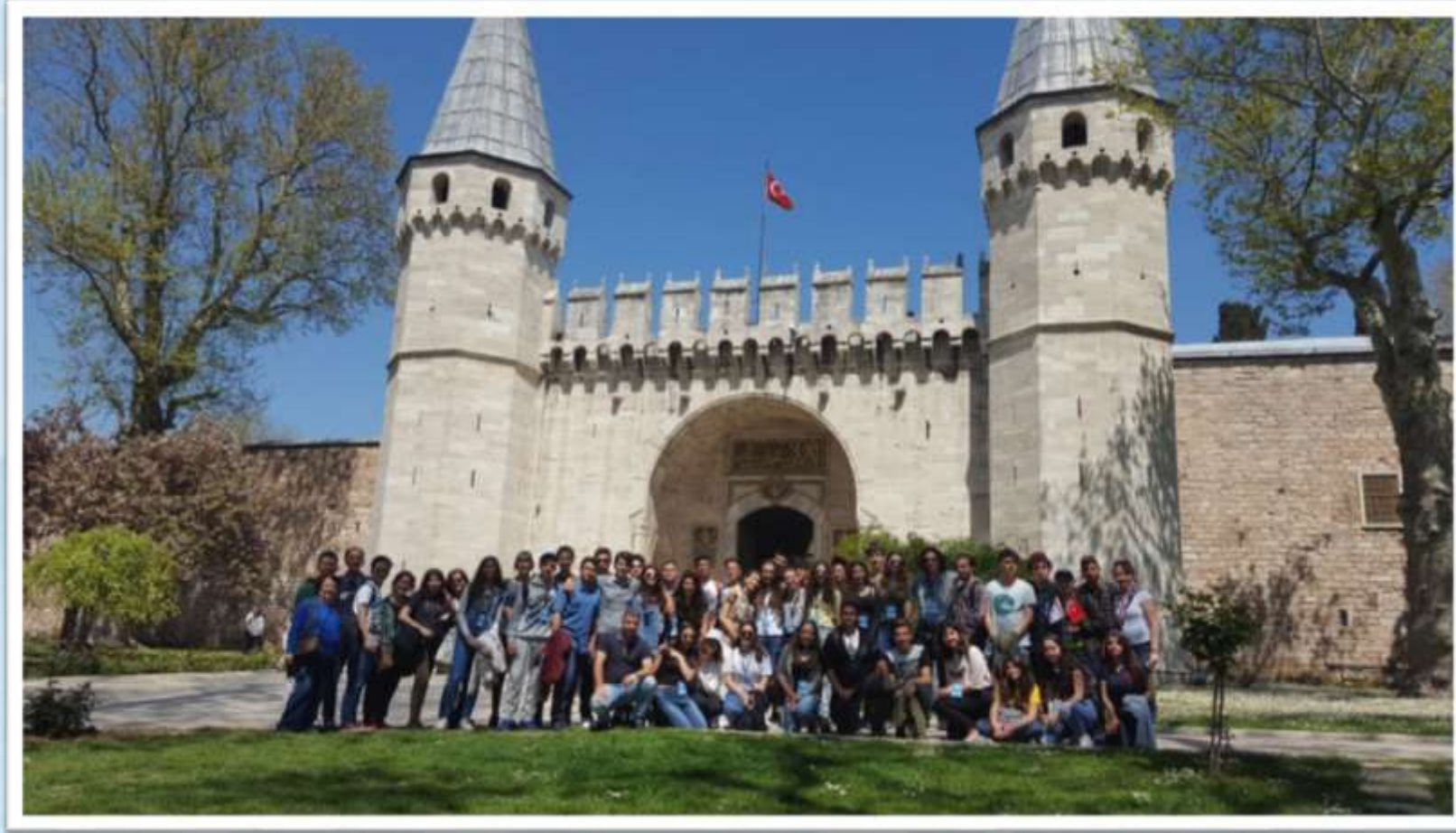
Topkapı Sarayı Gezisi