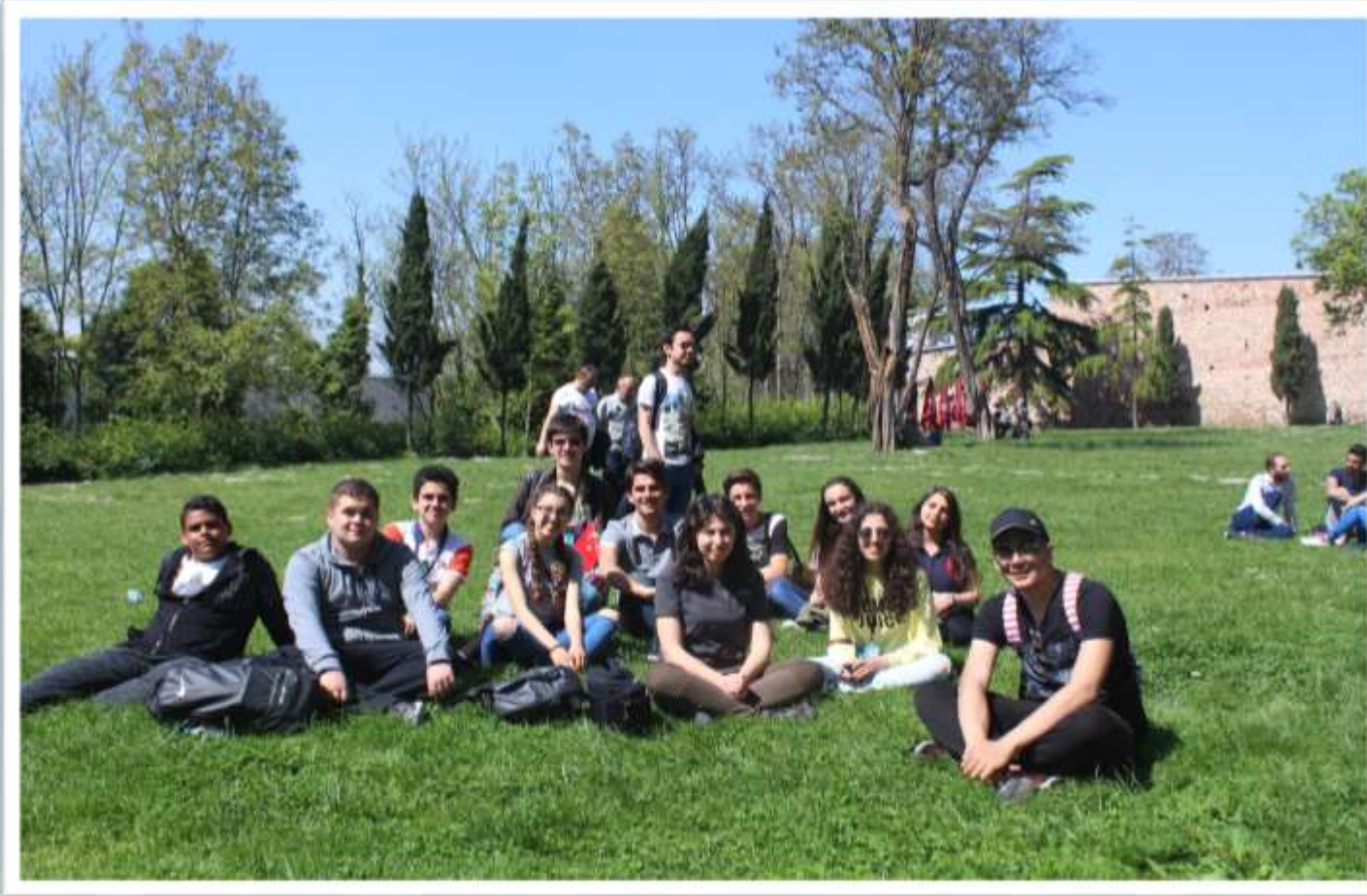
Topkapı Saray girişi