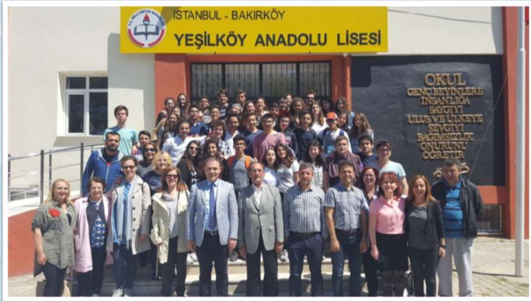
Büyük Aile Fotoğrafı