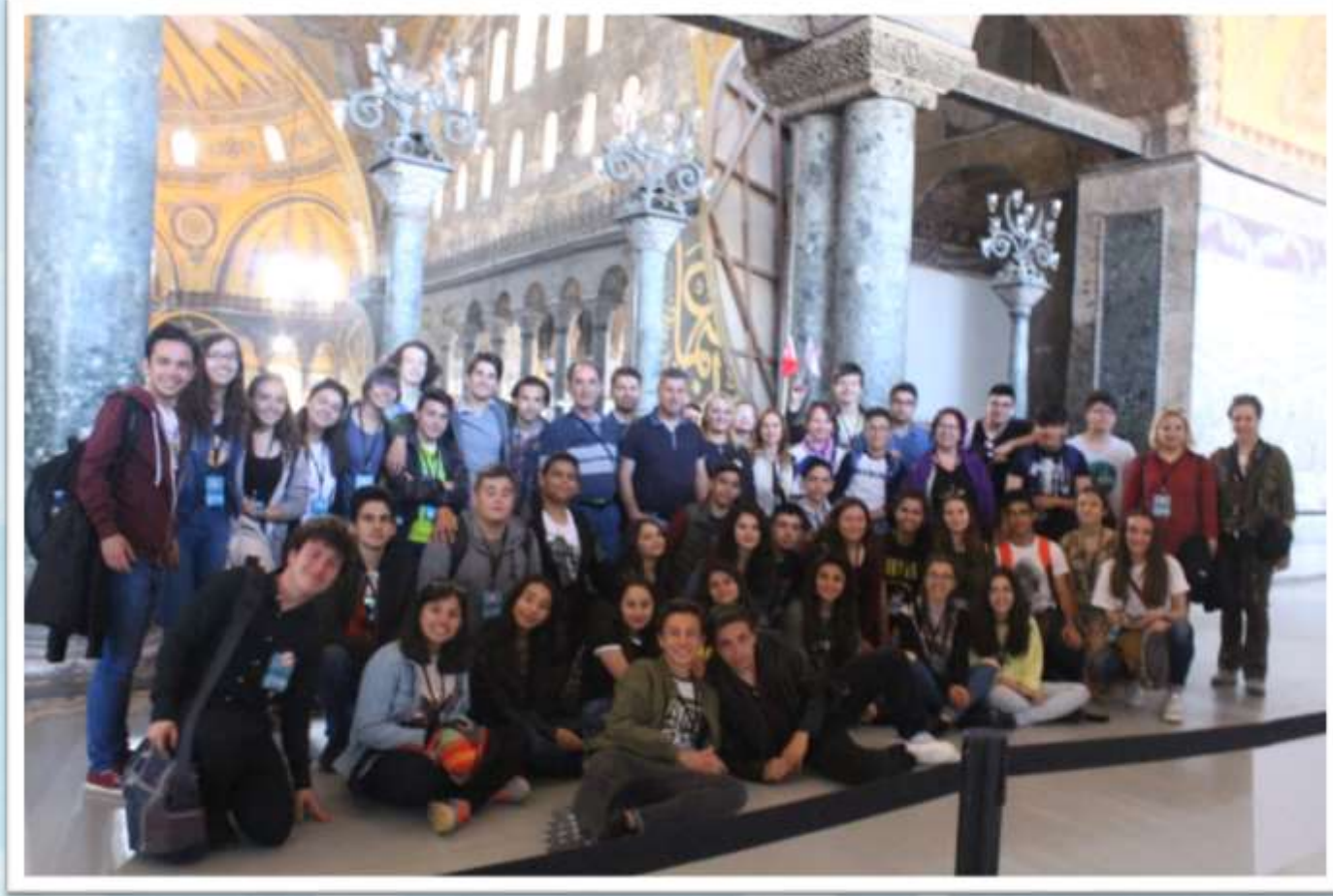
Ayasofya Müzesi Gezisi