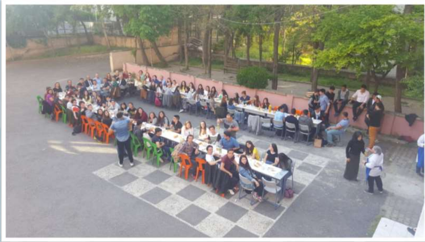
Bahçelievler Anadolu Lisesi'nde mangal keyfi