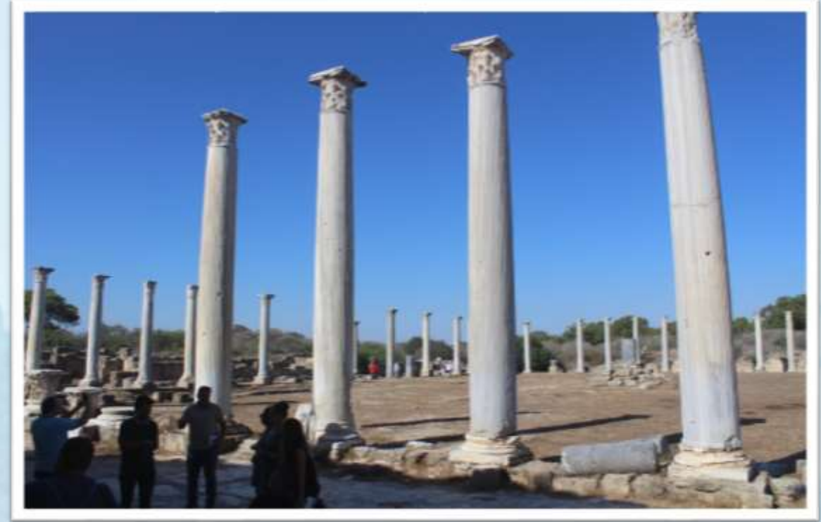
Sent Barnabas ve Salamis Harebeleri gezisi