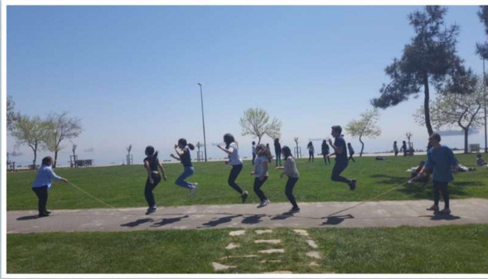
Piknik ip atlama