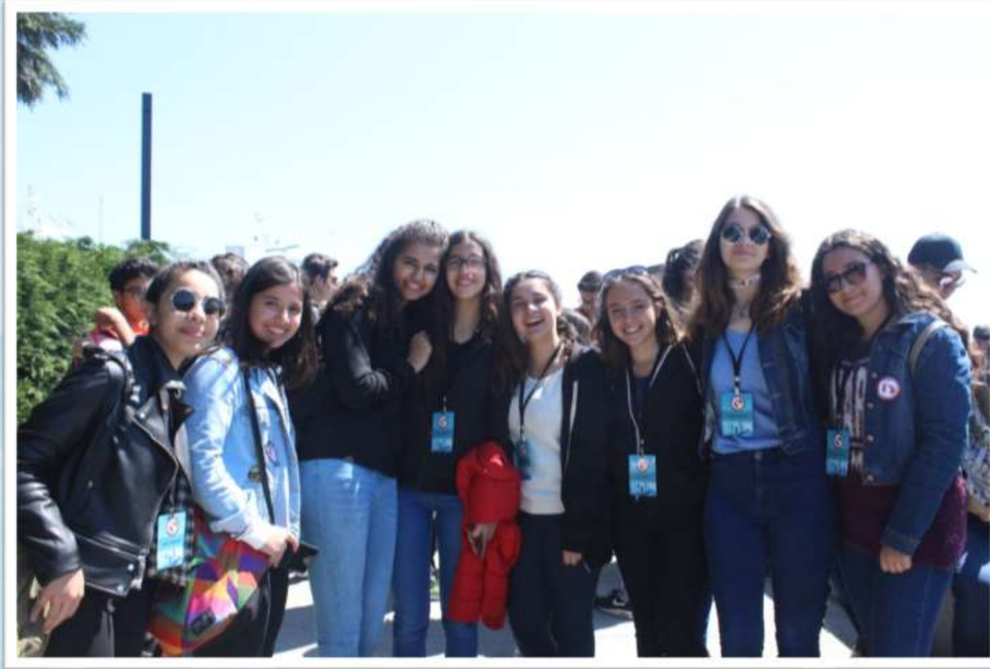
Florya sahil turu