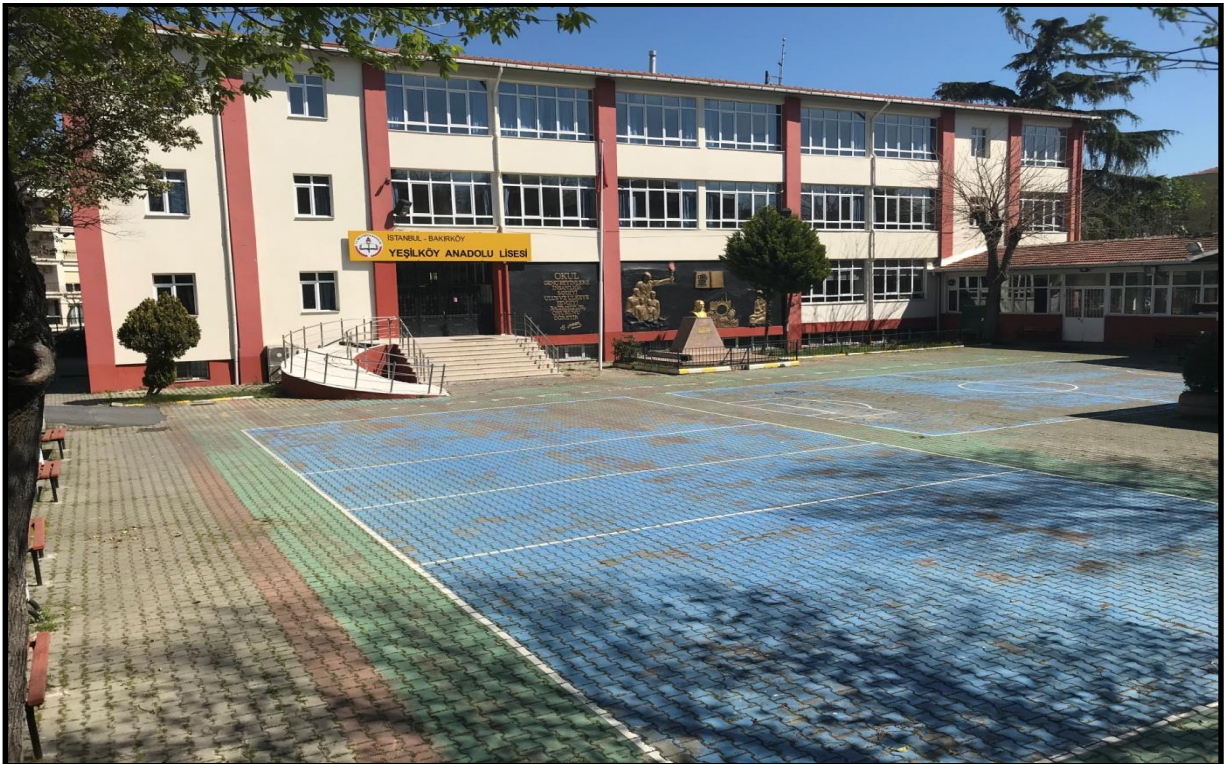
Ön Bahçe Görünümü