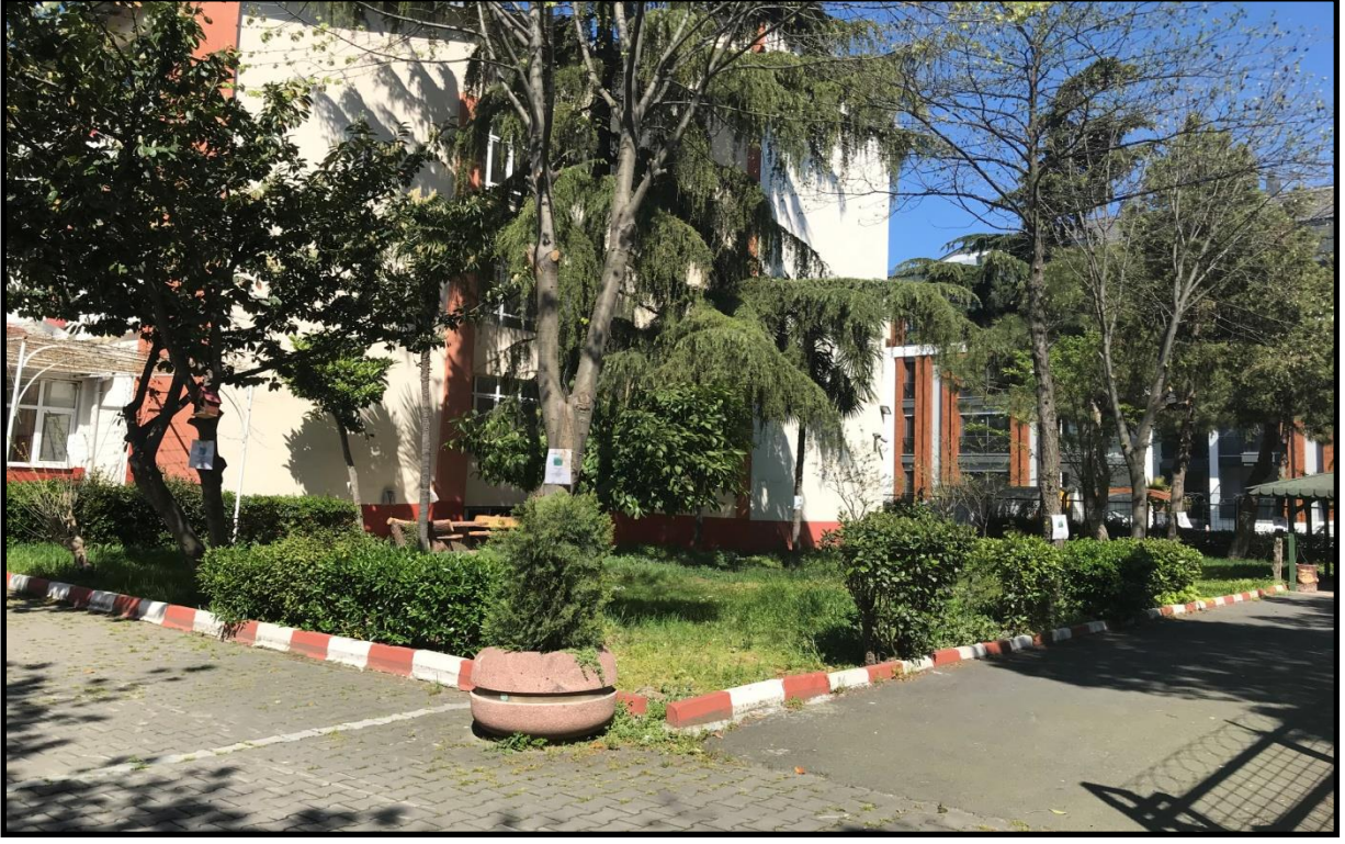
Okul Yan Bahçe Görünümü