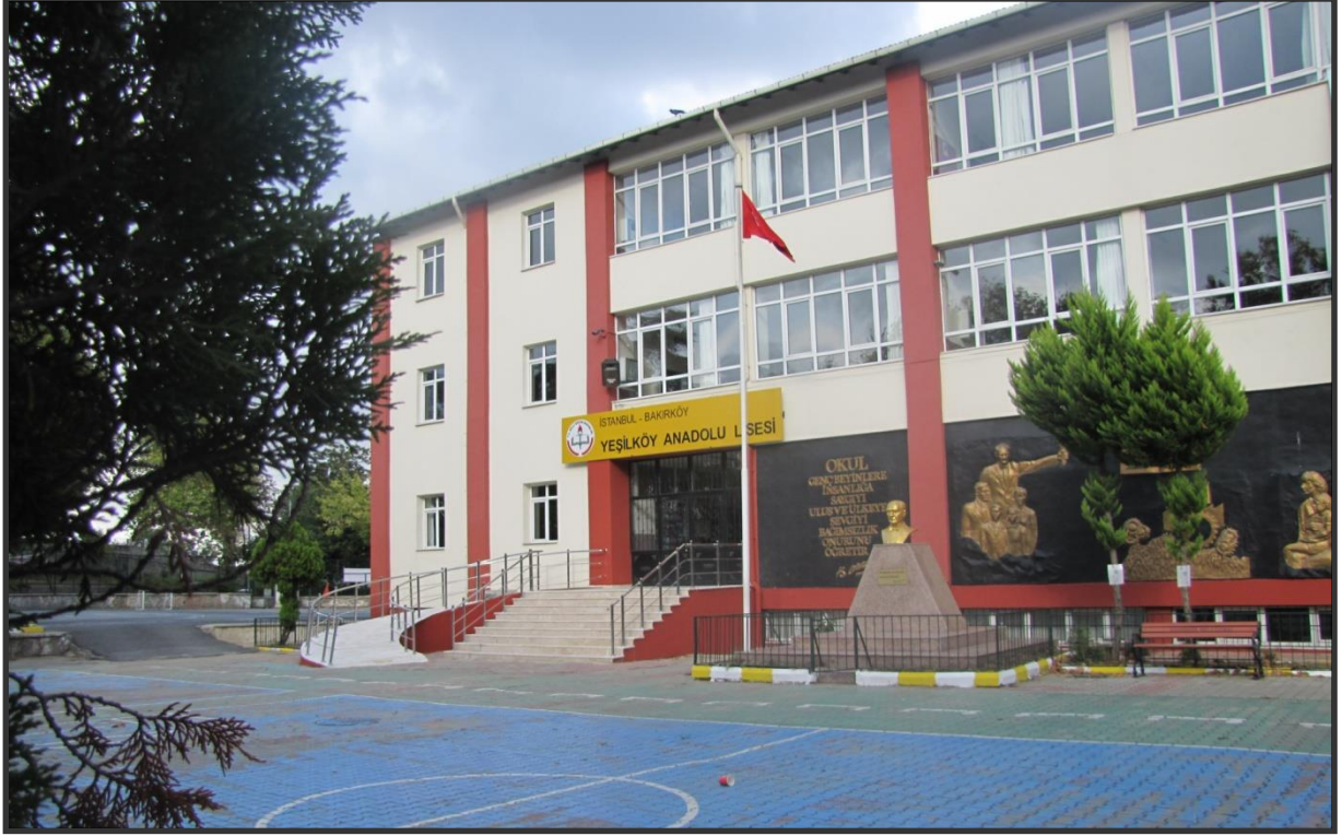
Okul Ön Bahçesi DıŐ Görünümü