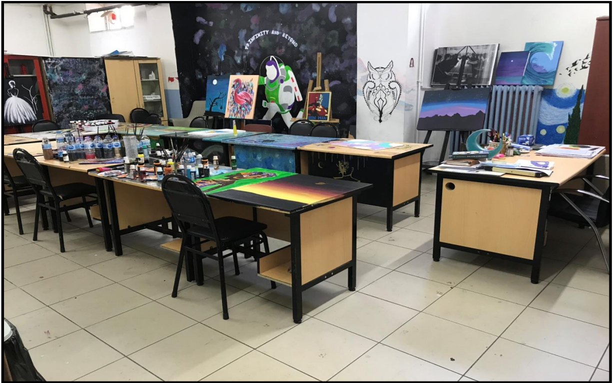
Görsel Sanatlar Sınıfı