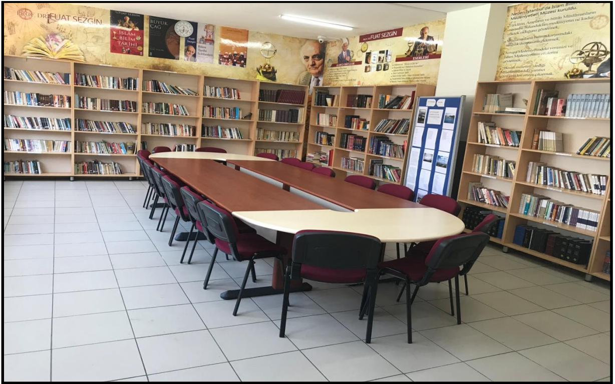
Fuat Sezgin Kütüphanesi