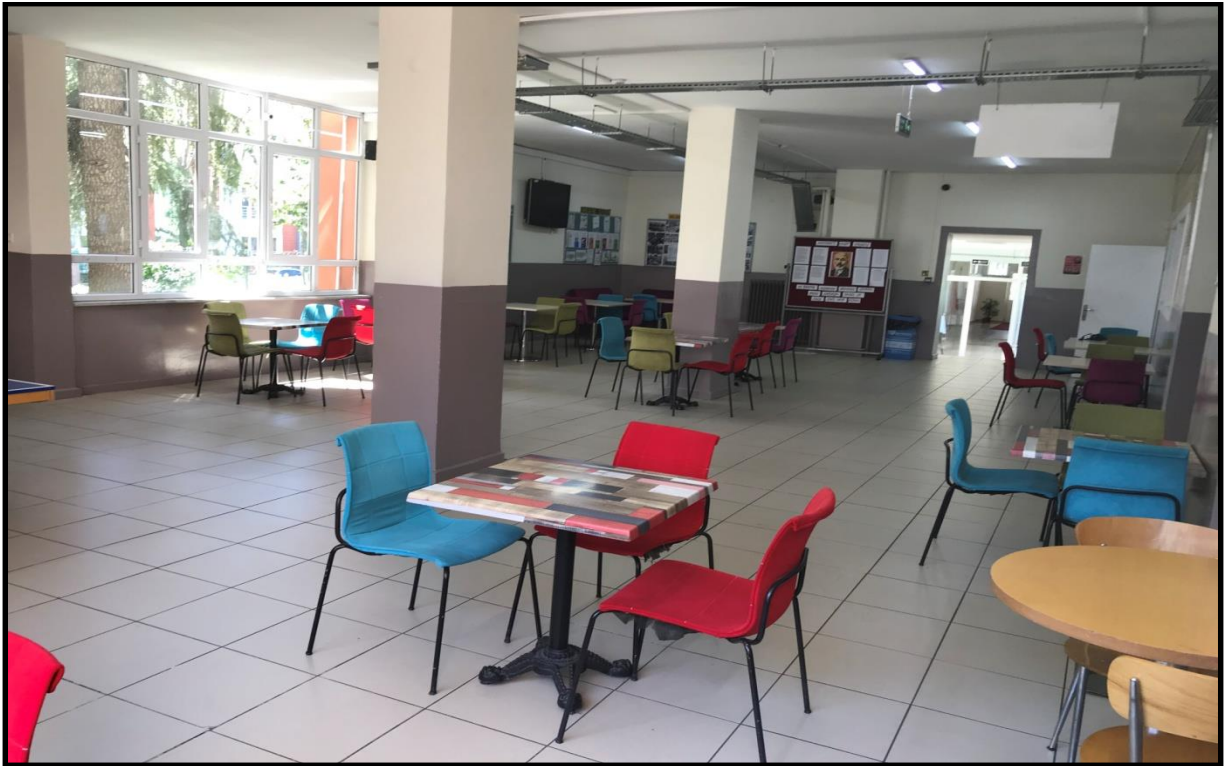
Okul Kantin Bölgesi