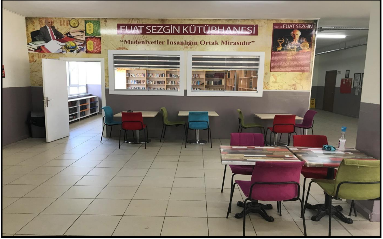
Fuat Sezgin Kütüphanesi