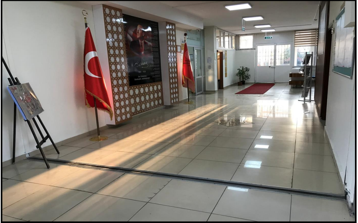
Okul İdari Girişi