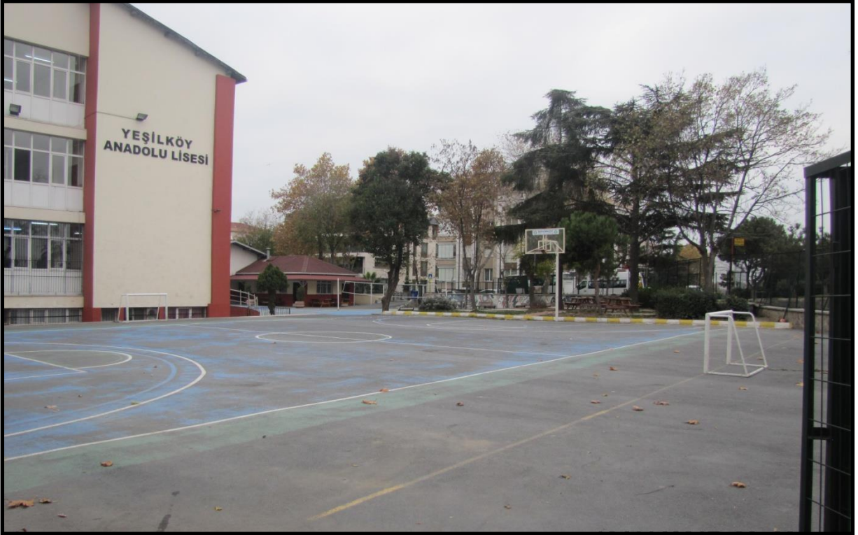
Okul Yan Cephe Görünümü